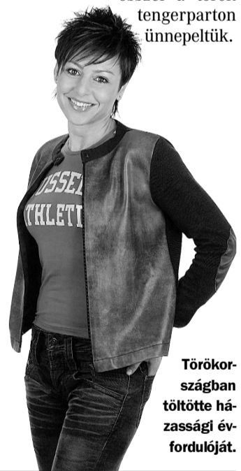
Törökországban töltötte házassági évfordulóját.

- Köszönöm, jól vagyok. Az idei évem jól alakult. Többször elmentünk pihenni a férjemmel. Sielni voltunk év elején, nyáron voltunk az Adrián, tízéves házassági évfordulónkat ősszel a török tengerparton ünnepeltük.