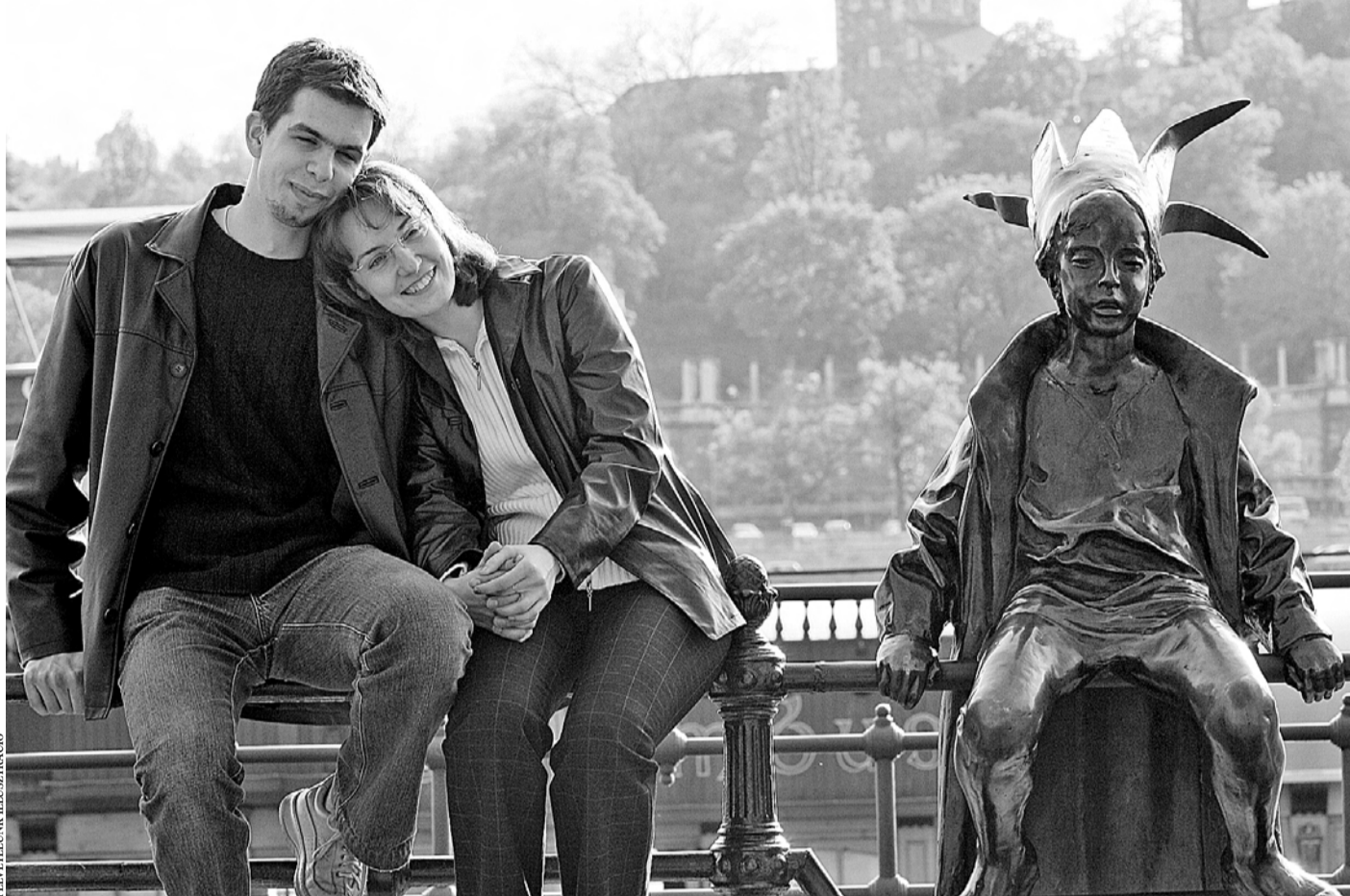
„Százézer éve várom, hogy rád találjak, s mikor itt vagy végre, nem tudom, hogy mit csináljak...” (Bárdos Deák Ági)

TÁRSKERESÉS Aki családot szeretne, az hajlik a kompromisszumra